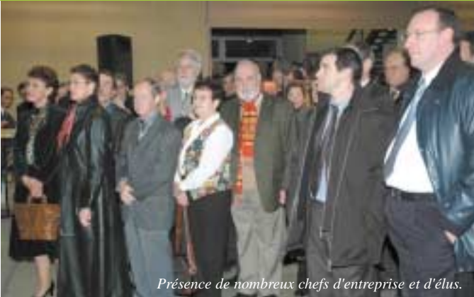
Présence de nombreux chefs d'entreprise et d'élus.