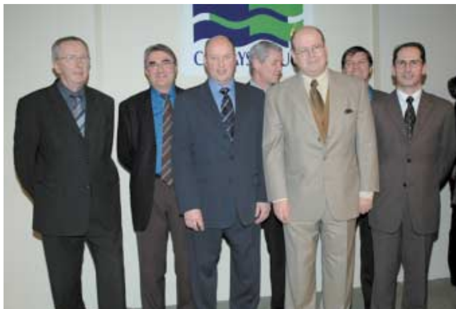
Les nouveaux membres du bureau en présence du Préfet de région Basse-Normandie, Cyrille Schott.

L'augmentation du taux de participation aux dernières élections est importante : 34,80 %. Ce beau score a été couronné par l'installation de la nouvelle chambre et l'élection de son Président sortant, Christian Fougeray, le 1 er décembre dernier, en présence de Cyrille Schott, Préfet de la Région Basse-Normandie. Plus de 350 chefs d'entreprises et d'élus étaient réunis.