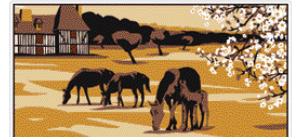
le pays d'Auge