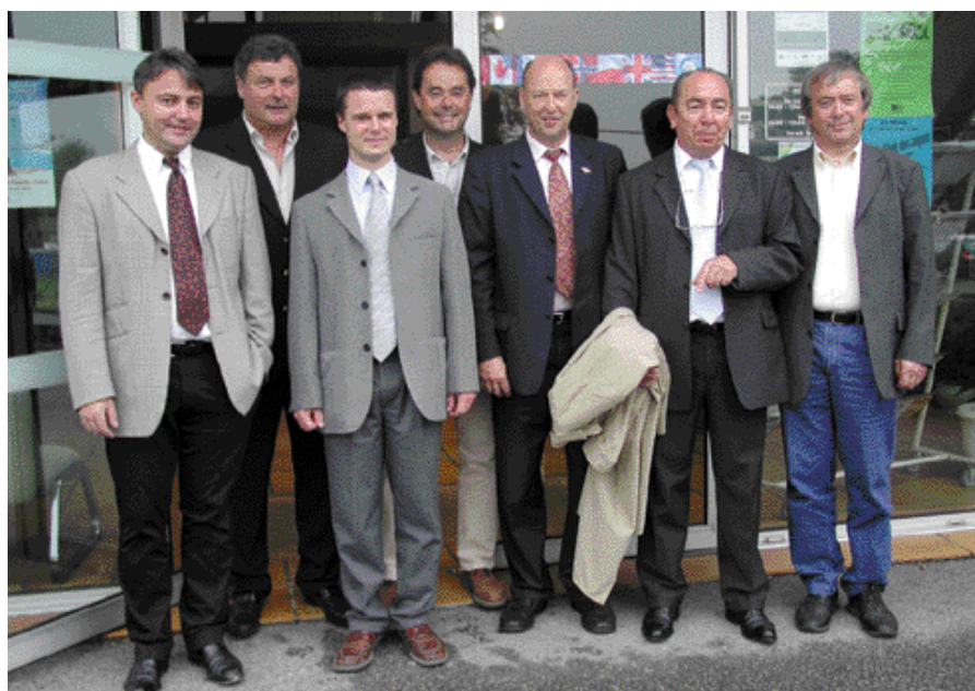
Les membres du club l'Auge-istique